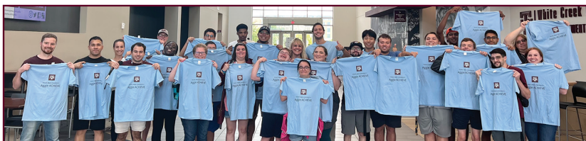
La primera oportunidad educativa inclusiva de cuatro años basada en certificados de Texas para adultos jóvenes con discapacidades intelectuales y del desarrollo.